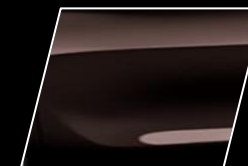
Marrón Café (4W9)