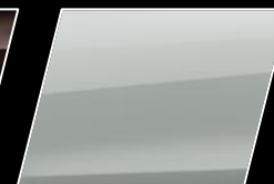
Blanco Perlado (089)