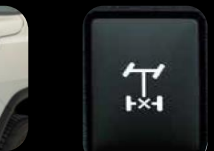
Bloqueador Dif. trasero