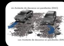
Sistema de arranque en Descenso (DAC)