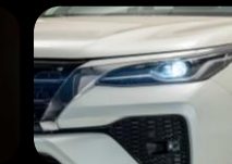
Luces Bi- LED