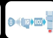
Inmovilizador de motor