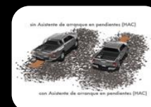
Sistema de arranque en pendientes (HAC)