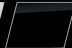
Negro Actitud (218)