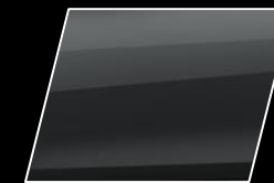
Gris Metálico (1G3)