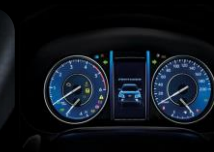
Pantalla TFT 4.2" multi-información