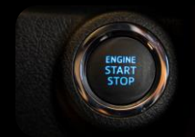
Botón de arranque