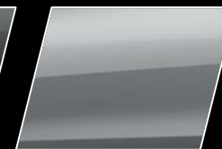
Plata Metalizado (1D6)