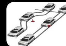
Frenos ABS con distribución electrónica de frenado (EBD)+ Asistente de Frenado (BA)