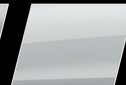
Super Blanco (040)